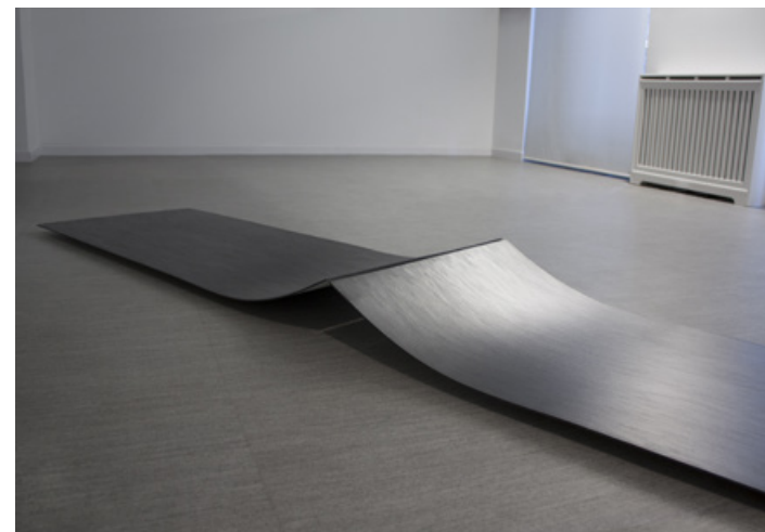
Sans titre , 2014